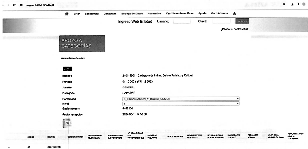
Fuente: plataforma CGN reporte UAPA-PAE.