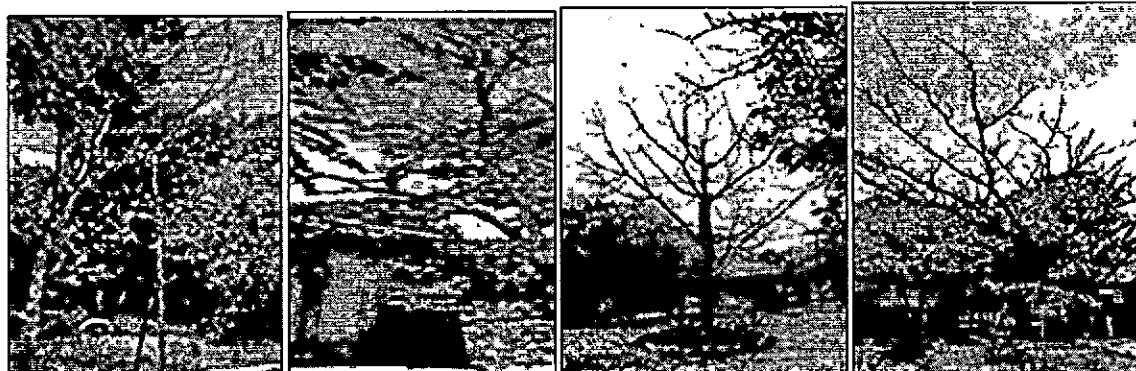
Imágenes Individuos de especie Santa cruz ( Astronium graveolens ), uno (1) de la especie Ceiba bonga ( Ceiba pentandra ) y especie Carito-Orejero ( Enterolobium cyclocarpum )

"Por la cual se autoriza una tala y se dictan otras disposiciones"