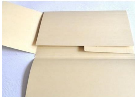
Carpeta tipo cuatro aletas en cartulina desacidificada Grafico 3

Las cajas y carpetas de archivo, se caracterizan por tener diseños funcionales y propiedades en los materiales de producción de permanencia, durabilidad y estabilidad física y química. No obstante, la utilización de estas unidades de conservación no es la única estrategia adecuada para lograr la prevención y control de los procesos de deterioro que pueden presentar los documentos; se requiere combinar su uso con una manipulación cuidadosa, unas condiciones ambientales estables y la implementación de rutinas de mantenimiento periódico de áreas de depósito. Por otro lado, es necesario igualmente implementar procesos de organización archivística ya que estos indican en gran medida el tipo de caja a utilizar, aunque es necesario anotar que las referencias de archivo central e histórico no son restrictivas y así el uso de las cajas y carpetas responden a las necesidades de almacenamiento y manipulación de los archivos dependiendo de los casos que presenten y que se requiera resolver.