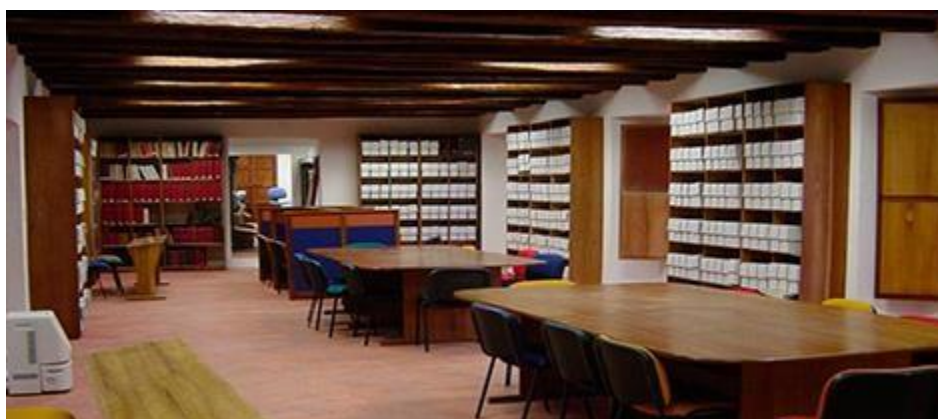
Archivo Histórico Cartagena de Indias Grafico 6