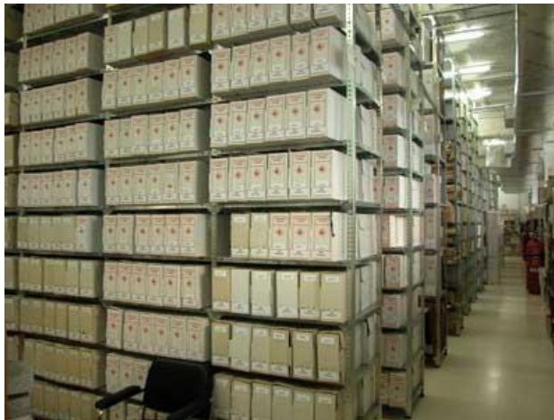
Archivo Central Grafico 5