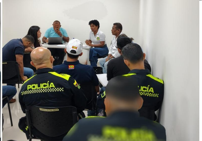
Evidencias de reunión preparatoria de agenda para el mes de la paz – septiembre de 2025. Lugar: Sala 1 piso 4 Personería Distrital de Cartagena.