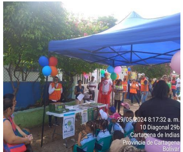
29/05/2024 8:17:32 a. m. 10 Diagonal 29b Cartagena de Indias Provincia de Cartagena Bolívar