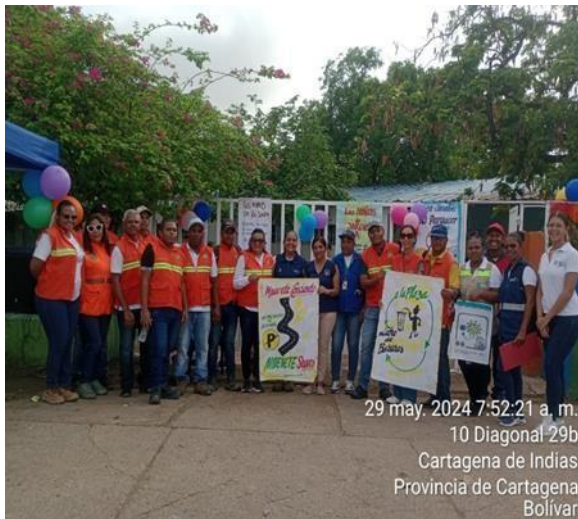
29 may. 2024 7:52:21 a. m. 10 Diagonal 29b Cartagena de Indias Provincia de Cartagena Bolívar