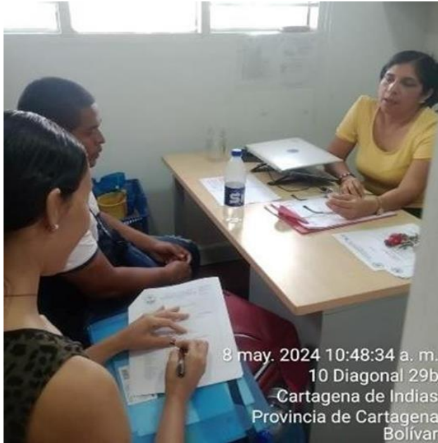
8 may. 2024 10:48:34 a. m. 10 Diagonal 29b Cartagena de Indias Provincia de Cartagena Bolívar