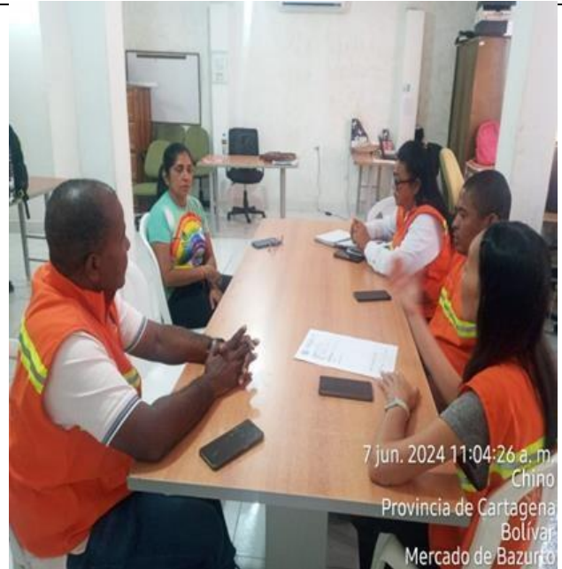
7 jun. 2024 11:04:26 a. m. Chino Provincia de Cartagena Bolívar Mercado de Bazurco