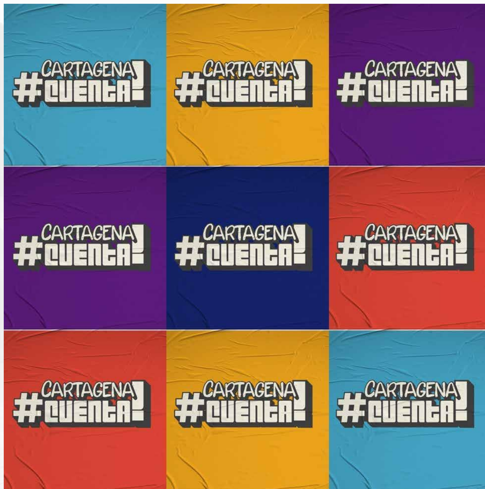
IMAGEN RENDICIÓN DE CUENTAS