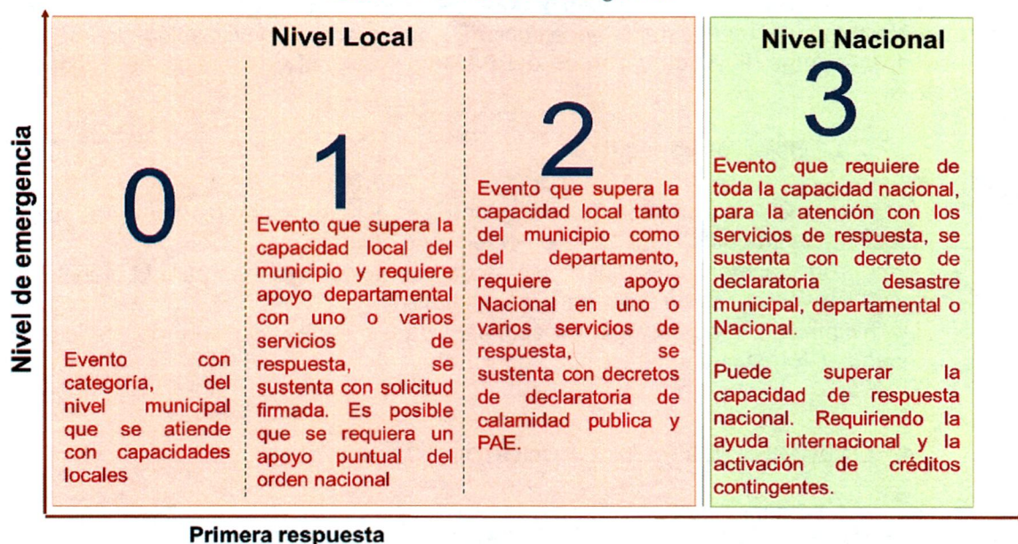
Tabla 1. Niveles de Emergencia

La Estrategia Nacional de Respuesta a Emergencias establece los niveles de emergencia según la capacidad de respuesta ante un evento: