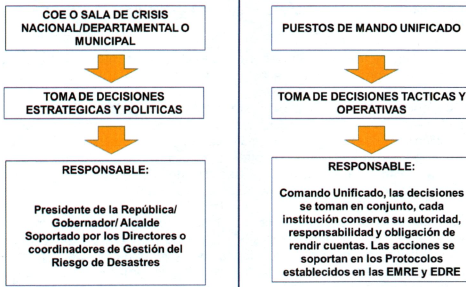
Figura 1 Relación COE (Sala de Crisis) – Puesto de Mando Unificado

Los Puestos de mando Unificado, operan bajo las características y principios del Sistema Comando de Incidentes. En una situación de Desastre o una emergencia compleja, puede haber varios PMU instalados, para garantizar el control y las operaciones en todo el territorio afectado.